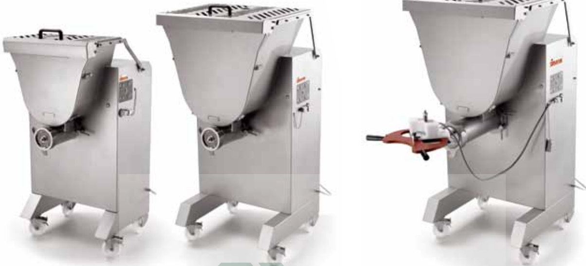
MASTER 30 Y12